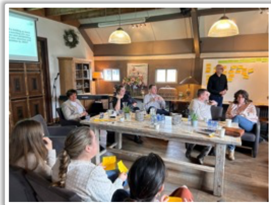
IPHC Nederland Dag – Vissie/Missie ontwikkeling