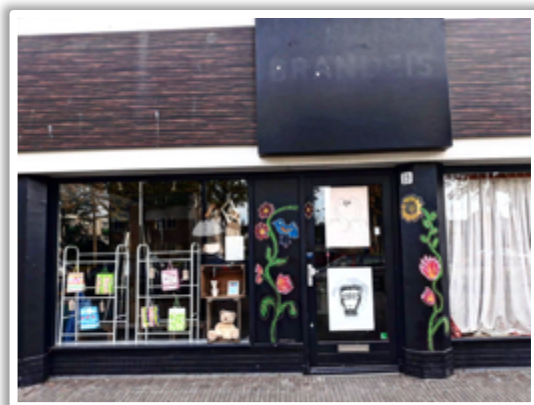
Weggeefwinkel in Amsterdam west